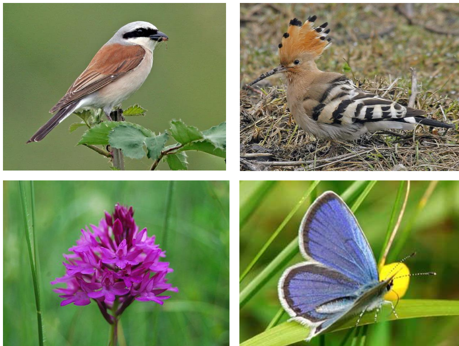
Figure 2 : La pie-grièche écorcheur, la huppe fasciée, l'orchis pyramidal et l'azuré du trèfle sont parmi les espèces-cibles favorisées par les mesures du réseau.

Au niveau du suivi biologique, là encore les mesures du réseau se sont avérées très satisfaisantes puisqu'elles ont permis la présence d'espèces rares et caractéristiques de la région dans des endroits inattendus. Ce suivi biologique a permis au réseau d'adapter ses méthodes et les recommandations de gestion afin d'être encore plus favorables aux espèces présentes.