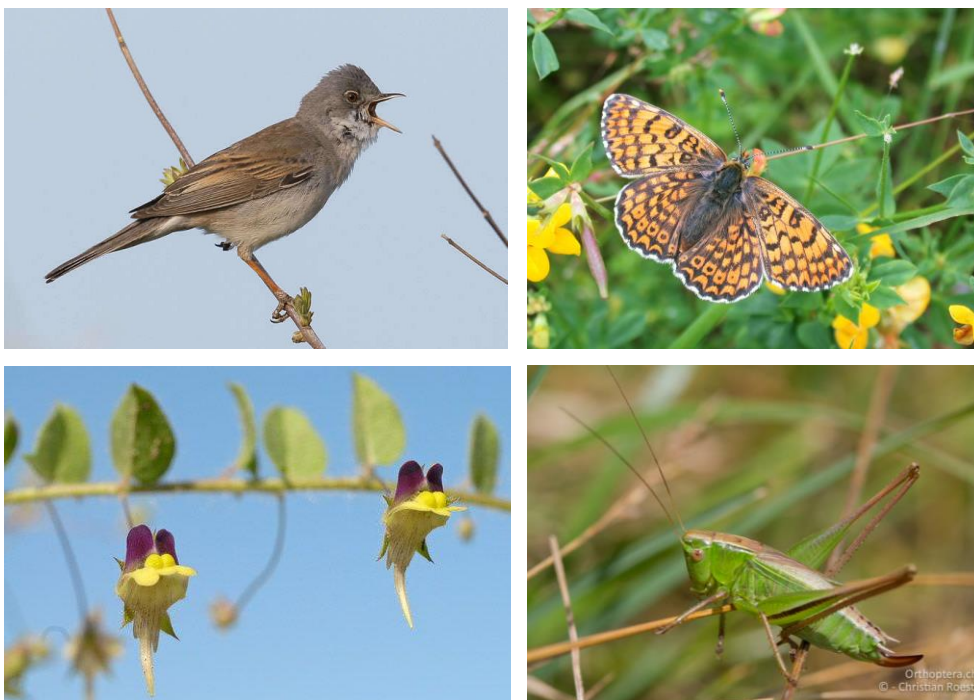
Figure 3 : La fauvette grisette, la mélitée du plantain, la linairé à feuilles hastées et la decticelle bicolore font partie des 12 espèces-cibles du réseau.

Sur la base des suivis biologiques effectués et du réseau écologique cantonal, des données de la Station ornithologique suisse, d'InfoSpecies et d'InfoFlora et des inventaires fédéraux, les espèces-cibles ont été légèrement adaptées par rapport aux phases I et II. Ainsi, deux espèces ont été ajoutées et trois retirées de la liste, en fonction de leur présence effective, la présence des milieux, et leur statut de protection. Le réseau a donc une liste de 12 espèces-cibles, comprenant 3 espèces de papillons, 3 espèces d'oiseaux 3 espèces d'insectes et 3 espèces de plantes.