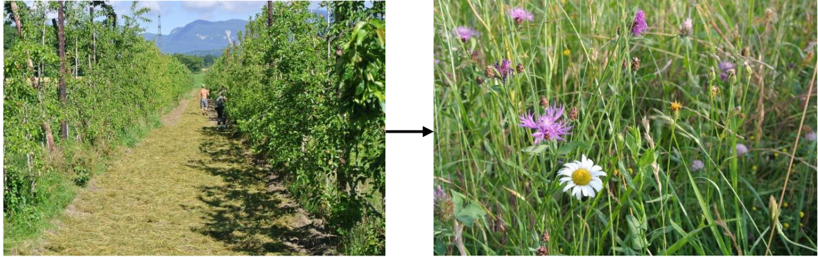
Figure 4 : Culture fruitière à biodiversité naturelle (M. Echenard, Tannay et Mies)

En outre, le réseau est pionnier pour la reconnaissance d'une mesure régionale spécifique pour les cultures fruitières.